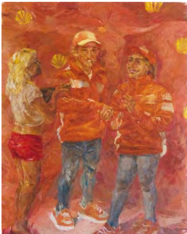
עלמה יצחקי, Shell People, 100x140, שמן על בד (2009)

יואב: כי ברגע שהוכחת שזה יכול להתמיד בזמן, גם עם א ו־ב וגם עם ג ו־ד וגם עם ה ו־ו, אז הוכחת ש־א בפני