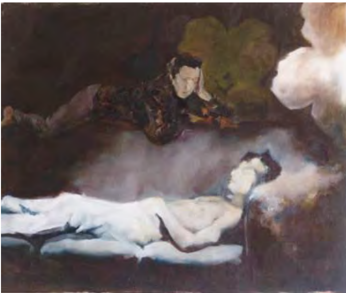
עלמה יצחקי, ספה, 55x50, שמן על בד (2008)

ואם הפחתי מן החדשנות הלשונית פה (בית 4 שורה 4) החזרתי שם (בית 3, מילה אחרונה). את המשקל, אפעס, השמדתי ללא רחם.