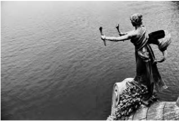
סדני טע'יגול, הצדק (2009)

לפני שמתרחש האירוע נשוא התביעה; במסגרת זו השאלה היא איך משפיע הכלל המשפטי הקיים על התנהגותם של פרטים בחברה באופן כללי, ו־ex-post (בדיעבד, לאחר שהצדדים הספציפיים מגיעים לבית המשפט ויש להכריע בתביעה). בהקשר זה, האידיאה של וויינריב היא בעייתית, כיון שהיא לא משאירה מקום לשיקולים משפטיים ex-ante (כגון הרתעה). זאת, מפני ששיקולים כאלה אף פעם אינם קשורים רק למערכת היחסים שבין שני צדדים, אלא לאופן שבו המשפט פועל לפני שהצדדים פונים אליו, דהיינו לחברה בכללותה. כלומר, ניתן לטעון שהאידיאה של וויינריב אינה מספקת הסבר לתופעה של המשפט הפרטי משום שההשלכות של כללים משפטיים ex-ante לא זוכות במסגרתן להתייחסות, או לכל היותר זוכות להתייחסות שלילית (נחשבת כ"חיצונית" למשפט הפרטי).