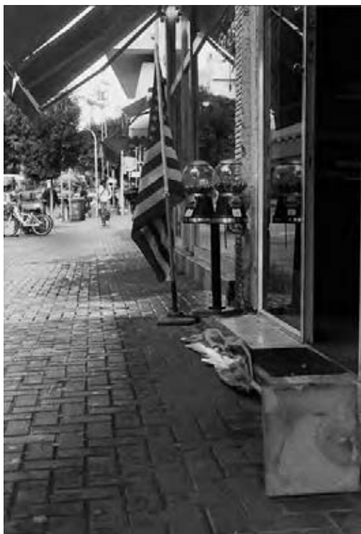
דגני סצ'נול, אמריקה הפילה את רוסיה (2009)

מעגל, כי אני מגדיר את היפה בתור מה שמתמיד בזמן, ואז מצדיק את זה כשאני אומר "זה היפה". אבל אני מאמין שזה לא צירוף מקרים, זה לא סתם מעגל.