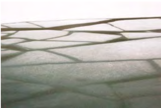
אהרן לוי, היילוגו, טיבט (2007)

נהוג להניח שכל שפה (שהיא בעצמה אובייקט סופי) מייצרת אין סוף משפטים. כמו כן נהוג להניח שיש קטגוריה דקדוקית \text{Sen} המותאמת למשפטים, ורק להם.