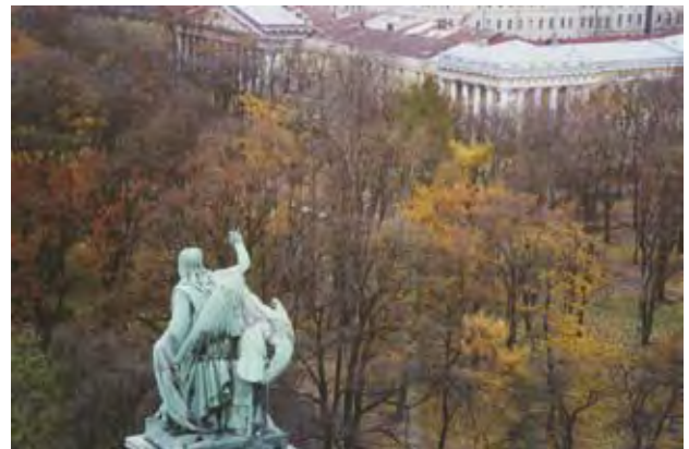
סרגיי סצ'יגול, מלאך ההיסטוריה (2009)