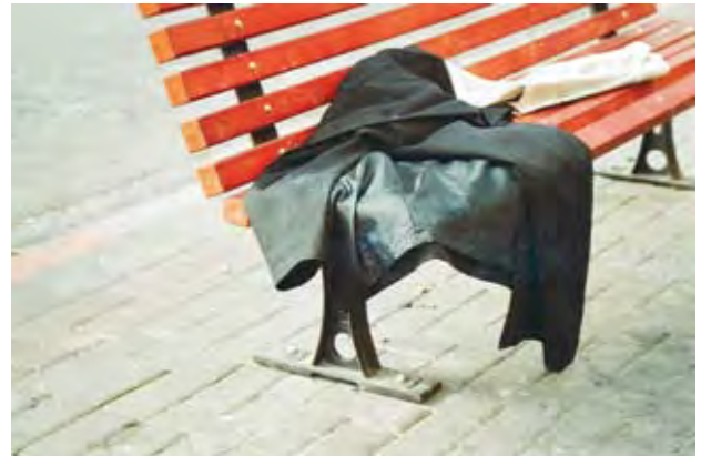
סרגיי סצימול, תעושי אבל תשאיר את המעיל השחור שלי (2008)

לא מפסיקה לחלום מאז שעזבת אתה בועט בתוכי כמו אסיר בעל כרחו ואני הודפת שיהוקים קולניים. כאלו צחקתי שעות.