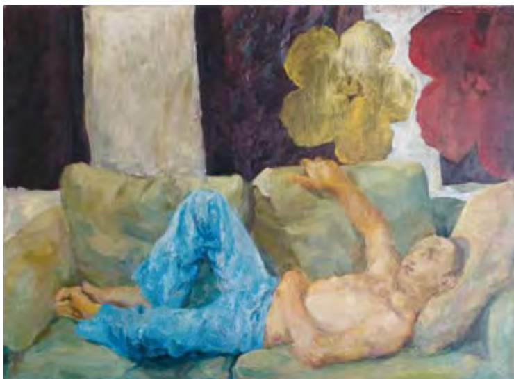
עלמה יצחקי, ספה 1, 160x125, שנתן על בד (2009)

ברור שיש לטפל בה. אך דווקא אצל המתמטיקאי, נראה שעל פני השטח ניתן להסתדר יפה גם מבלי יכולת לתת דין וחשבון פילוסופי. רוב העולם נמצא במצוקה פילוסופית והעולם עומד על כנו, בניין שרייבר בפרט.