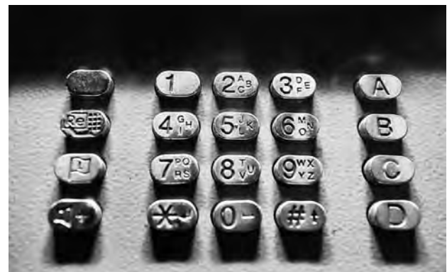
דגני סציגול, מספרים קטנים (2009)

מצב זה, שהיה בלתי נסבל עבור המתמטיקאים, הביא אותם לחיפוש אחר בסיס איתן למתמטיקה, שיספק את הביטחון שסתירות כגון הפרדוקס של ראסל לא ישובו עוד. התפתחויות פורצות דרך בלוגיקה ובתורת הקבוצות באותה התקופה עודדו את התחושה שהמטרה בהישג יד. למאמץ הנדיר הזה קורא הרש בשם הכללי "foundationism" 5 ובמסגרתו טרחו טובי המוחות המתמטיים והפילוסופיים במשך כמה עשורים לנסח אותו בסיס חמקמק למתמטיקה. גישות שונות הוצעו להגשמת המטרה, אך במאמר זה אציין רק את הבולטת שבינן, שקודמה על ידי מי שנחשב לגדול המתמטיקאים של זמנו – דייוויד הילברט. "הפרויקט של הילברט" היה שאפתני ומורכב ביותר. הגשמתו