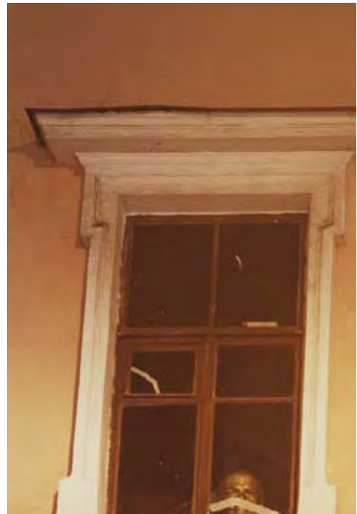
סרגיי סצ'יגול, ולדימיר אליין, סנט פטרבורג (2009)

מתן: אז פה נראה לי שיש לך משהו – לא בדיוק אתנוצנטרי, אולי טכנו-צנטרי. הוא בא מתוך עידן השעתוק