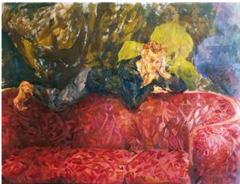
עלמה יצחקי, ספה 2 (2009)