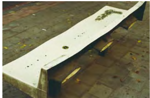
דרגי סצ'יגול, ספטל (2009)

ארנדט מבחינה בין המושגים "בידוד" ו"בדידות": הראשון, שמאפיין משטרים עריצים, מחרב את המרחב הציבורי, כלומר את היכולות הפוליטיות של בני האדם. השני, מאפיין משטרים טוטליטריים ומתאר מצב שבו בנוסף על החרבת המרחב הפוליטי נחרבים גם מה שארנדט מכנה "חיי הפרט". מאפיין זה של בדידות מתרחש כלפי כל הפרטים תחת המשטר הטוטליטרי וגוזר את הפגיעה ביכולתו של האדם לחוות את