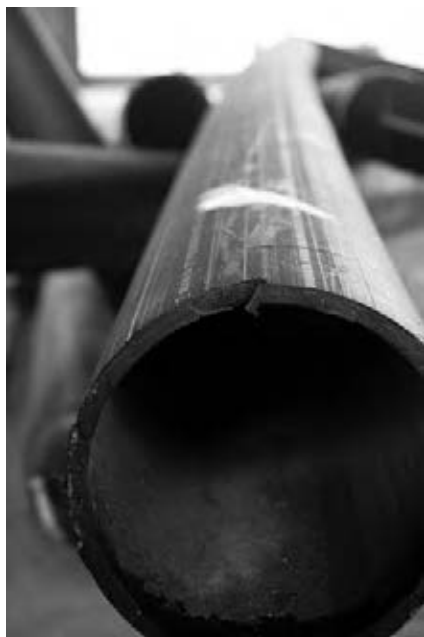
דנה קרני, אתר בנייה, יפו (2008)

הוא מהותי. אך מהו חוסר התאמה מהותי? התשובה, לדעתי, היא שאידיאה צריכה לספק הסבר לתופעה. אם האידיאה לא מסבירה את התופעה, אז ישנו חוסר התאמה מהותי ביניהן. בהמשך לכך, הסבר צריך להיות מלא ולהשתרע על כל התופעה. אם הסבר לא יכול להקיף את כל ההיבטים של התופעה, הוא חלקי בלבד. אבל אידיאה לא יכולה להיות הסבר חלקי של התופעה שלה; היא חייבת להיות ההסבר המלא. זהו מאפיין אינהרנטי של הקשר שבין אידיאה לתופעה.