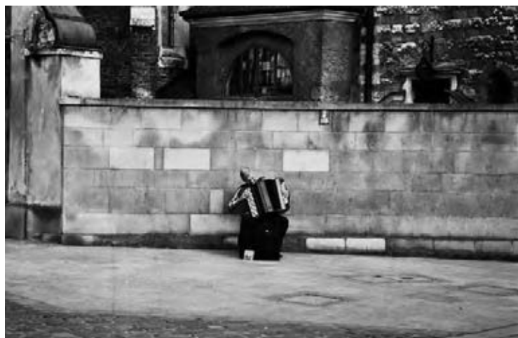
סריי סצ'יול, קרקוב (2009)

מערכת הדינים שחלה על אותה התרחשות (למשל, אם הפשע התרחש במדינה מסוימת, יכול להיות שתחול עליו מערכת הדינים של אותה המדינה) וכן כדי להכריע האם נעברה עבירה, מהו העונש המתאים, ושאר ההכרעות שלהן הוא נדרש. משפטי השואה מעלים קושי למשפט הפלילי בכל אחד משלביו. אני רוצה להתמקד באותו שלב ראשון ובסיסי, של זיהוי ושל הבנת התרחשות. כפשוטו – השלב שבו נדרש המשפט לזהות ולהמשיג את רצף האירועים שבו הוא עוסק, ושאותם הוא אמור לשפוט. הבנה זו של המשפט את התרחשויות מחייבת הבנה של רקע חברתי-פוליטי (שלעתים מצטמצם לכדי הבנת המסגרת החוקית שחלה