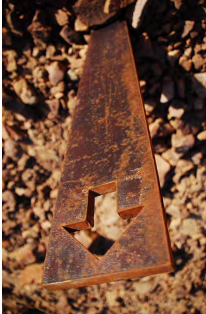
אהרן לוי, מצפה המזרח (2009)