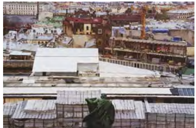
סרגיי סציגול, מלאך המתמטיקה, סנט פטרבורג (2009)