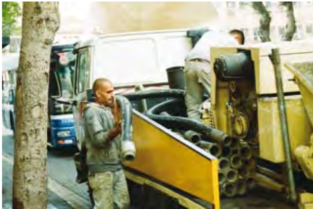
סרגיי סצ'יגול, עיגולים (2009)

הרנגה חותרת לאיזון בין יציבות לשינוי. כל חוליה (קטע בן שתיים/שלוש שורות קצרות) היא המשך של