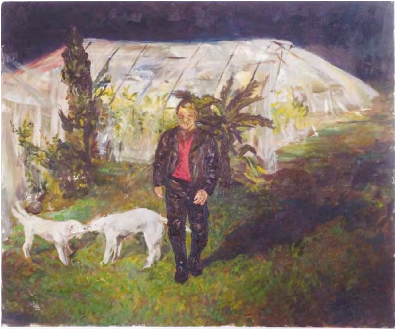
עלמה יצחקי, תממה, שמן על בד, 115x100

קאנט יצד תורת יפה כללית. אני רק מראה את זה במוזיקה (עמ' 20)